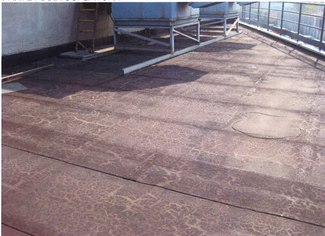
PARTICOLARI CORPI IN APPOGGIO