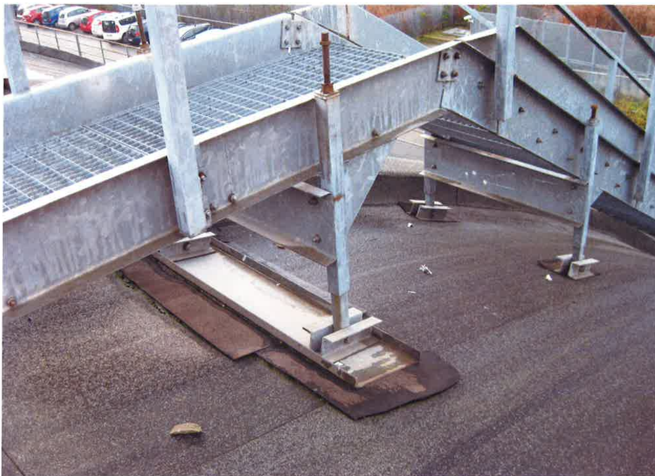
CORPI IN APPOGGIO