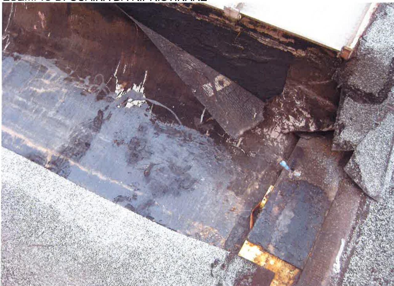
ESEMPIO LATTONIERA DA SOSTITUIRE