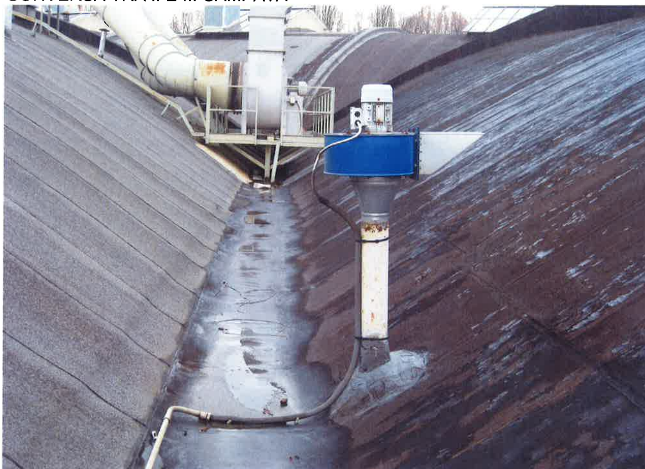
INTERSEZIONE TRA LE CAMPATE